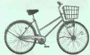
・自転車の点検・整備をお願いします。