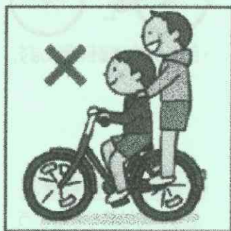
二人乗り運転禁止