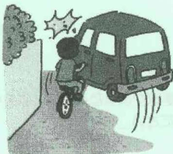
飛び出し運転禁止