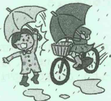
かささし運転禁止